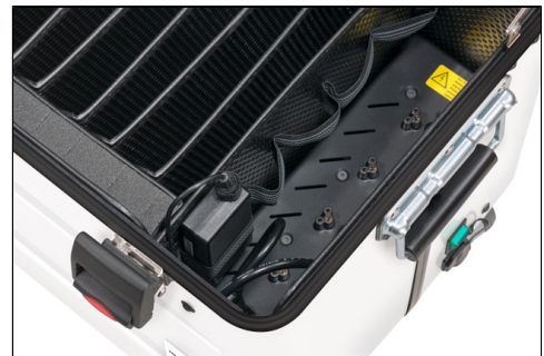
- Staufach für Netzteil