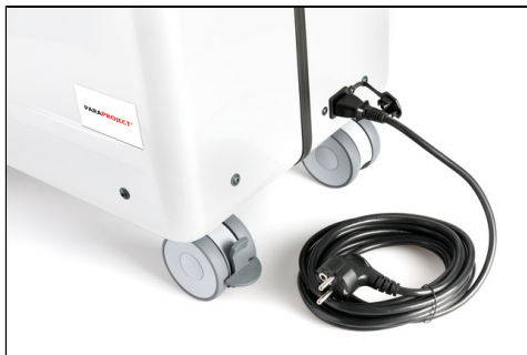
- zentrale Stromversorgung mit Schutzkappe